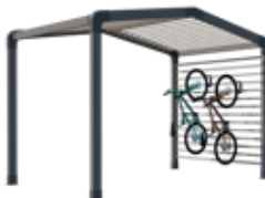
Range-vélos et/ou stockage