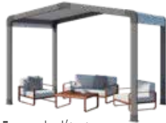
Espace de détente